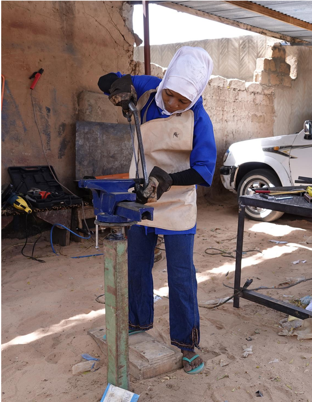
Formation à la construction métallique, Niger

Une copie du rapport d'audit ainsi que du rapport financier 2019 (en allemand) peut être commandé directement auprès de l'adresse ci-dessous. Les deux rapports peuvent également être consulté sur notre site.